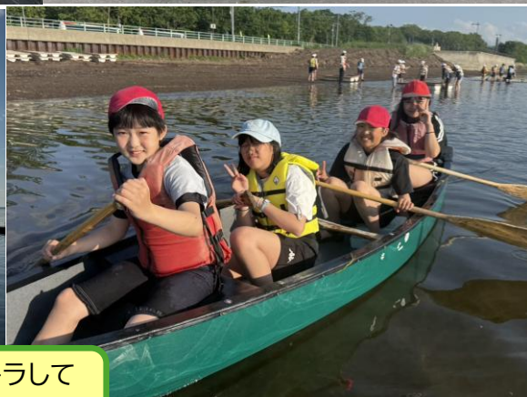
湖面がキラキラしてとても綺麗ですね！