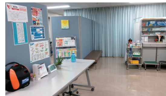
保健管理センター