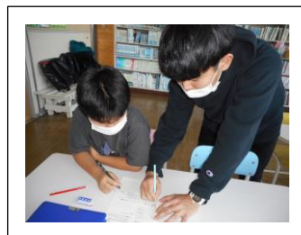
【児童に支援を行っている様子】